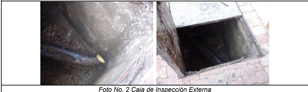
Foto No. 2 Caja de Inspección Externa