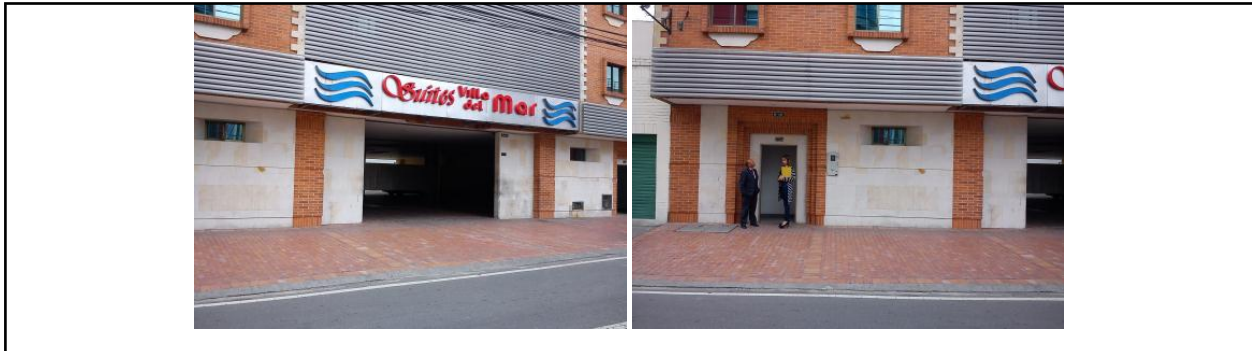
Foto No. 1 Fachada Establecimiento

Se realizó visita técnica a las instalaciones SUITE VILLA DEL MAR, el día 20-03-2014, donde se estableció que tiene como actividad principal el alquiler de servicio de habitaciones. Durante el recorrido se observó que en el piso superior de la empresa se encuentra una zona de fregado donde se realiza el lavado de tendidos (sábanas, cobertores y fundas de almohada) con una frecuencia diaria de 40 lavados aproximadamente, puesto que se realiza dicho lavado posterior al alquiler del servicio de habitación. Existen equipos tales como lavadora, centrifugadora y secadora industrial, de los cuales se generan vertimientos de agua residual no doméstica que son tratados con un sistema de tratamiento preliminar que consta de rejillas, no se observó trampa de grasas ni otro tipo de componente. El usuario cuenta con una caldera que funciona a gas y la purga de la caldera se realiza con una frecuencia semestral.